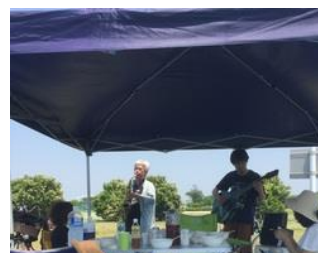
▲優雅な午後のコンサート♡

子どもたちの中には初めてのバーベキューという子もあり、お肉、野菜、焼きそば、おにぎりなどを食べおなか一杯に。差し入れのフルーツは、食後のデザートに。