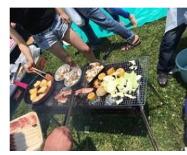
▲見て下さい。この食欲!!

楽しい1日になりました。皆様、ご協力ありがとうございました。次回の「まんぶく食堂」の予定は6月19日(日)になります。