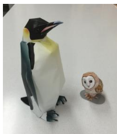
▲皇帝ペンギンとメンフクロウ。たくさん作って集めたいぐらいかわいい♡

ペーパークラフトについての詳細は Canon Creative Park をご覧ください http://cp.c-ij.com/jp/categories/CAT-ST01-0071/top.html