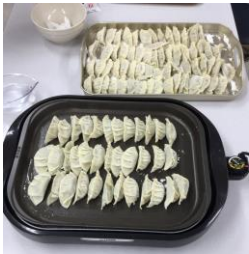
▶みんなで作った百個の餃子。迫力の作です

今まではぼんやりとじているだけの生活でしたが、だんだん次回の調理実習で作りたいものを考える事が日課になりました。