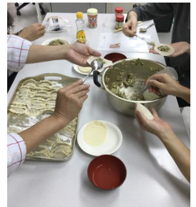
▲この日の調理実習のメニューは餃子。みんなで餃子の具を包んでいきます。初心者ばかりなのにみんな手際良く具を皮に包んでいきます。

週に数回10時に集まり昼食のメニューを決めて、材料の買い出しを職員さんと一緒にかけます。慣れてきたら実習生だけで買い出しに行き、調理をしてみんなで一緒に食事をとります。