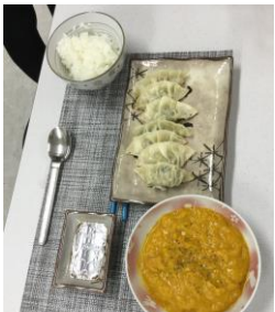
▲餃子とかぼちゃのポタージュ。栄養満点メニュー

美味しそうな料理の番組を見つけたら真剣に調理方法を観察したり、メモをとるようになりました。