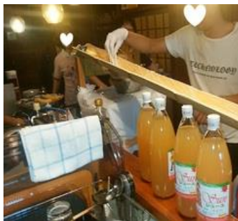
▲いよいよ流しそうめん大会が始まります。

本日は特別企画のためいつもより早めに準備を開始。流しそうめんの準備は万全!と思いきや、竹に水を流すホースが無いという事実が発覚。スタッフが急ぎよ百均に走るといってハプニングもありましたが、夏の風物詩流しそうめん大会は無事始まりました。