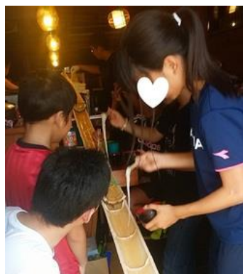
▲譲り合いをしながらも自分の食べたい分はしっかり獲得。

今日のメニューは流しそうめん、だし巻卵、ウィンナー、高野豆腐、きゅうりを塩昆布であえたもの、万願寺とうがらしとじゃこ炒め、デザートはスイカとアイスクリームの差し入れ。おかげで別腹もいっしょに。